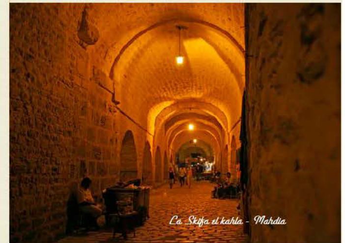
La Siqia el kahla - Mahdia

Il est vivement conseillé aux confrères qui ne sont pas à jour pour leurs cotisations de profiter de la journée pour régulariser leur situation.