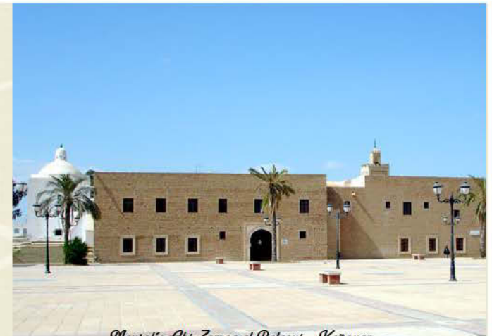
Mausolée Abi Zouaa al Balaou - Karouan

L'inscription est gratuite pour tous les médecins.