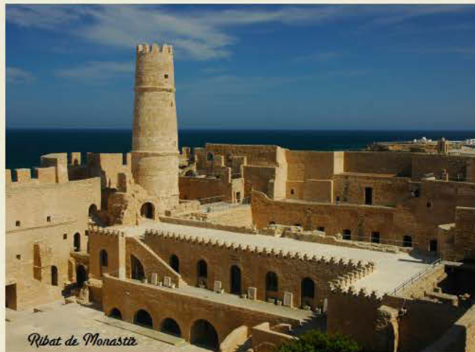
Ribat de Monastir